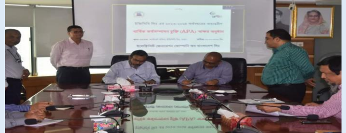
ইজিসিবি'র ২০২৩-২০২৪ অর্থবছরের অভ্যন্তরীণ বার্ষিক কর্মসম্পাদন চুক্তি স্বাক্ষর অনুষ্ঠানের একাংশ