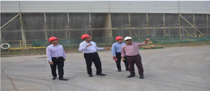
ইজিসিবি'র চেয়ারম্যান মহোদয়ের সিদ্ধিরগঞ্জ ৩৩৫ মেঃ ওঃ সিসিপিপি পরিদর্শনের একাংশ