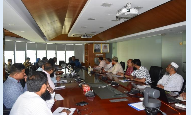
ইজিসিবি'র বিভিন্ন দপ্তরের কর্মকর্তাগণের অংশগ্রহণে অনুষ্ঠিত বিভিন্ন প্রশিক্ষণের স্থিরচিত্র