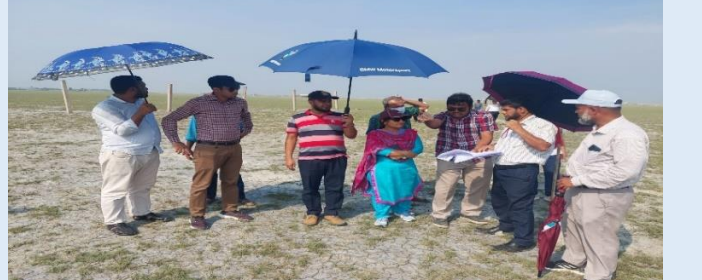
ভূমি অধিগ্রহণ প্রকল্পের সম্ভাব্যতা যাচাই এর নিমিত্ত জেলা প্রশাসন কর্তৃক প্রস্তাবিত ভূমি ও ইজিসিবি'র চলমান প্রকল্পসমূহ পরিদর্শনের একাংশ।