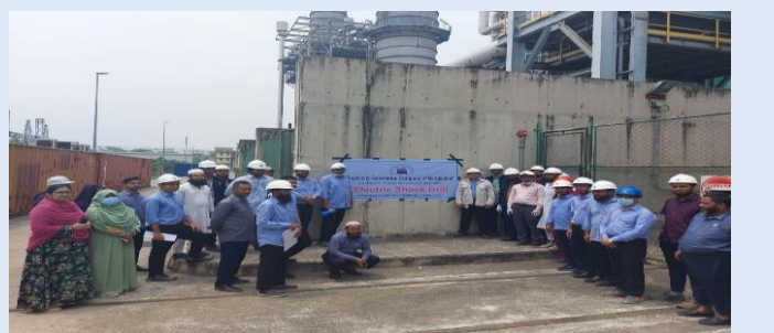
সিদ্ধিরগঞ্জ ৩৩৫ মেঃ ওঃ সিসিপিপি তে অনুষ্ঠিত ফায়ার ফাইটিং ও ইলেক্ট্রিক শক ড্রিলের একাংশ