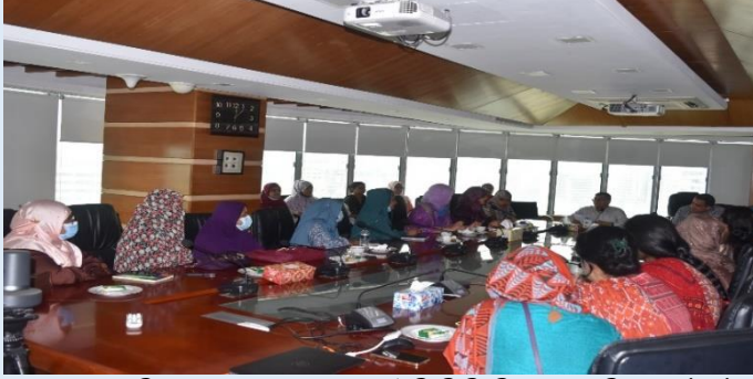
ব্যবস্থাপনা পরিচালক মহোদয়ের সাথে ইজিসিবি লিঃ এর মহিলা কর্মকর্তা কর্মচারীগণের সভার একাংশ

০৬ জুন ২০২৩ তারিখে ইজিসিবি লিঃ এর সকল মহিলা কর্মকর্তা কর্মচারীগণের সাথে ব্যবস্থাপনা পরিচালক মহোদয়ের মত বিনিময় সভা অনুষ্ঠিত হয়। উক্ত সভায় মহিলা কর্মকর্তাগণের কর্মপরিবেশ ও নিরাপত্তা বিষয়ক আলোচনা ও এর প্রেক্ষিতে সম্মানিত ব্যবস্থাপনা পরিচালক মহোদয়ের পক্ষ হতে প্রয়োজনীয় দিক নির্দেশনা প্রদান করা হয়। সভায় সকল মহিলা কর্মকর্তা ও কর্মচারীগণ ইজিসিবি লিঃ এর কর্মপরিবেশ সন্তোষজনক ও নিরাপদ বলে মত প্রকাশ করেন।