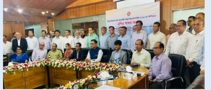
বিদ্যুৎ বিভাগের সাথে আওতাধীন দপ্তর/সংস্থা/কোম্পানির ২০২৩-২০২৪ অর্থবছরের বার্ষিক কর্মসম্পাদন চুক্তি স্বাক্ষর অনুষ্ঠানের একাংশ