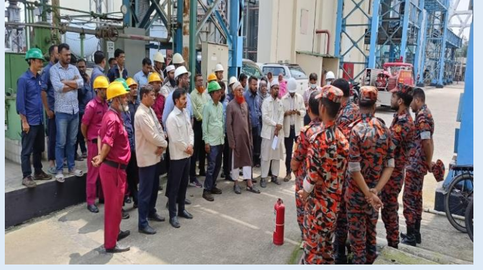
হরিপুর ৪১২ মেঃওঃ কন্সাইন্ড সাইকেল বিদ্যুৎ কেন্দ্র এবং সিদ্ধিরগঞ্জ ২X১২০ মেঃওঃ পিকিং পাওয়ার প্ল্যান্টে ফায়ার ড্রিলের একাংশ